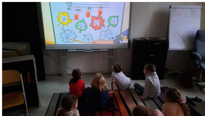
Někdy výuku zpestří videa od paní učitelky. To si pak připadáme jako v kině.