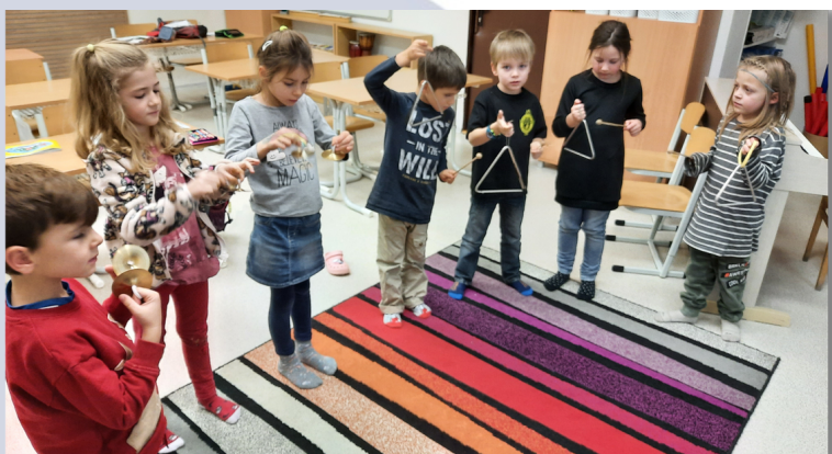
A to je naše kapela, se kterou umíme doprovodit všechny naše písničky.