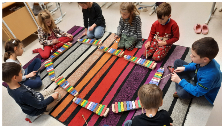
Moc nás baví hra na barevné zvonkohry. Zde jsme zrovna zpívali a hráli vánoční koledy.

Jak již název napovídá, v těchto hodinách se děti připravují na budoucí hru na hudební nástroje, která probíhá od druhého pololetí, ale již od září se seznamují s notami, dokonce si je vyzkouší psát.