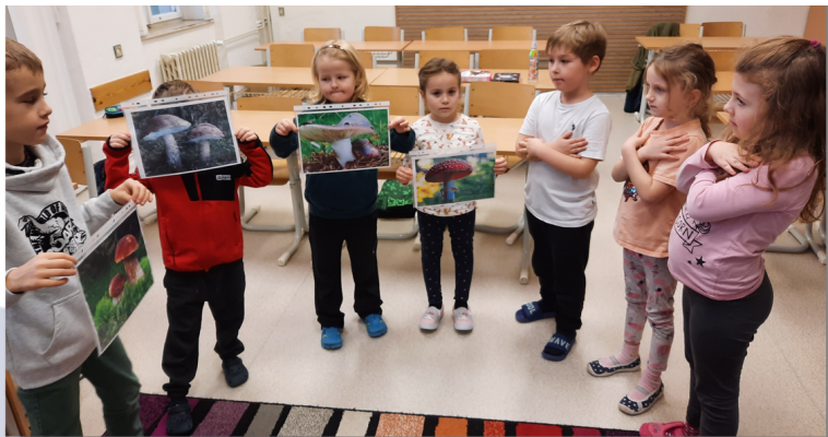
Zašli jsme si i do lesa na houby a zazpívali si o nich.