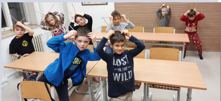
V prosinci se z nás stali čertíci, naučili jsme se čertí a mikulášskou písničku. To byla švanda!

Děti se rovněž učí rozvíjet sluch a rytmus, občas si zatancují či zahrají na různé rytmické nástroje, jako je například bubínek, drhlo, dřívka, zátky, triangl, zvonkohra, boomwhackery a další. A k tomu všemu si vždy rády zazpívají. Činnosti v PHV jsou zkrátka pestré a některé z nich si můžete prohlédnout na fotografiích z hodin.